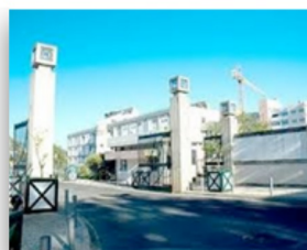
Universidad de Algarve